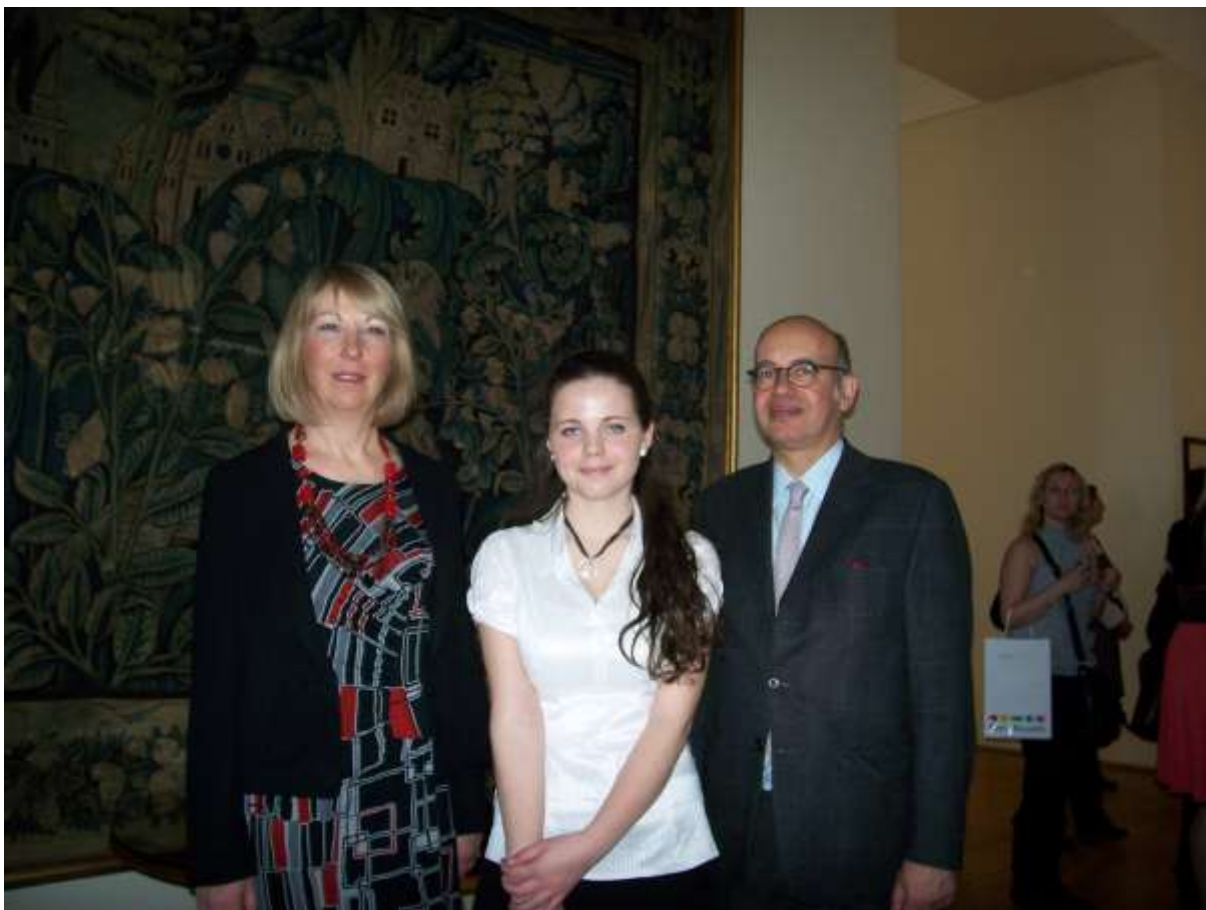
Společná fotografie ve slavnostních prostorách Černínského paláce