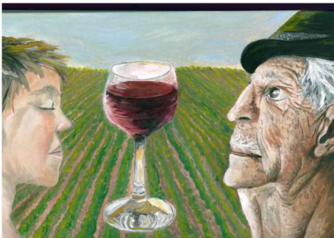
Detail oceněné práce –olejomalba na plátně