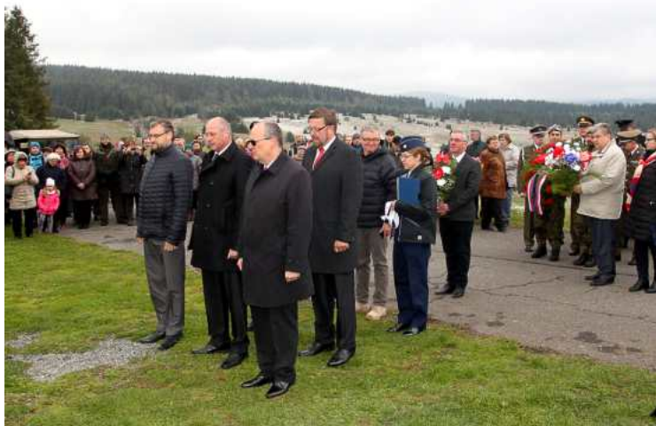
Loňský pietní akt na Zhůří.