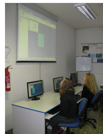
modelování součástí pomocí počítačového programu