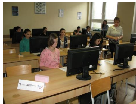
seznámení s obchodní korespondencí, využití ICT v oblasti účetnictví