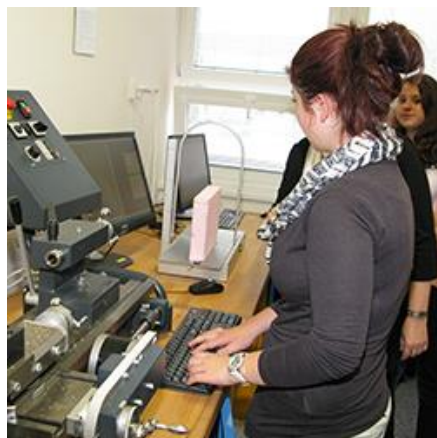
návrh, kreslení a zhotovení výrobků na CNC frézce, CNC soustruhu a drátové řezačce